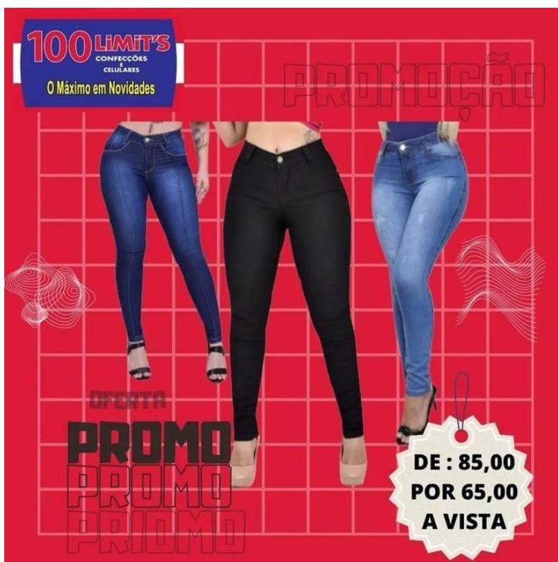
Figura 1: Exemplo de postagem para impulsionamento das vendas pela internet

A seguir, é apresentado um exemplo de postagem para essa estratégia.